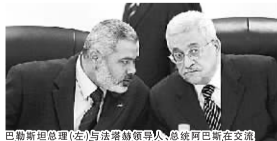
巴勒斯坦总理(左)与法塔赫领导人、总统阿巴斯在交流

伊斯梅尔·哈尼亚,1987年大学毕业后领导学生运动反抗以色列,属哈马斯温和派。1998年被任命为亚辛的办公室主任。2006年哈马斯大选获胜后,成为巴勒斯坦总理。