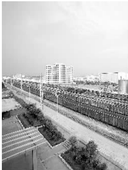
漯阜铁路货物运输连年创新高

外经济下行压力较大，机车乘务员又面临从内燃到电力分批培训转型的情况下，采取“强营销、活运价、分压力、明责任、提效率、挖潜力”等措施，使客货运量较 2014 年又实现了较大幅度的提升，到年底客货换算周转量有望实现 46 亿吨公里，再创历史新高。周口及沿线近几年经济快速发展，离不开这条铁路的有力推动。