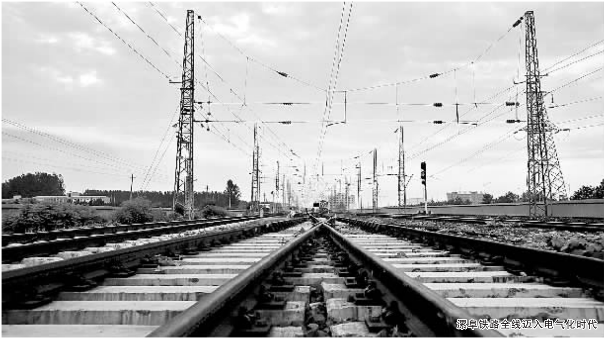
漯阜铁路全线迈入电气化时代

漯阜铁路西起京广线的漯河站，东连京九线的阜南站，全长 206.74 公里，为国家 I 级复线电气化铁路。漯阜铁路有限责任公司主要开办货物和旅客运输业务，货物运输可办理全国各铁路营业站的货物发送和到达业务，旅客运输业务目前开行周口—北京西、周口—广州、周口—上海始发终到列车，另有 3 对途经旅客列车，分别是重庆北—周口—南通、天津—周口—信阳、青岛北—周口—襄阳。 漯阜铁路在全国路网中具有重要的经济和战略地位，是连接京九线、京广线两大国铁主干线的黄金联络线，是河南腹地通往华东沿海地区的最便捷的铁路运输通道。日前，漯阜铁路又全力推进增开旅客列车、增加铁路运力，构筑起地方经济发展的生命线。