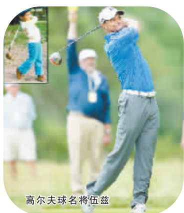
高尔夫球名将伍兹