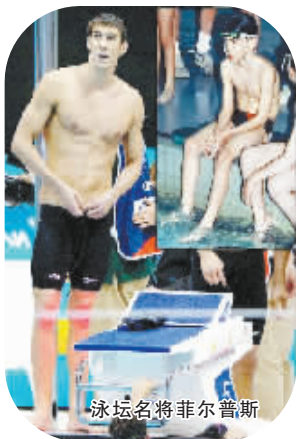
泳坛名将菲尔普斯