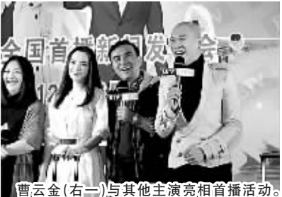
曹云金(右一)与其他主演亮相首播活动。