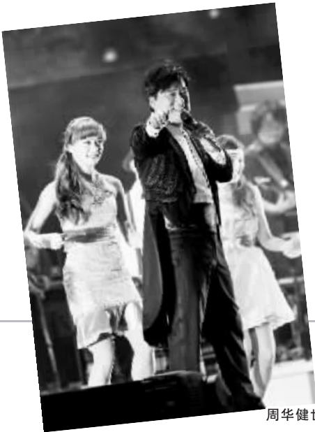
周华健世界巡回演唱会现场。

她还坦白，过去的一年间，连轴转的工作方式让她几乎无暇陪伴女儿，就连刚刚摘得香港金像奖影后也来不及庆功，“我现在觉得就是要多陪陪孩子。我妈妈批评我和我先生，我们太忙了，很少看女儿，一看到她就有点过于溺爱。可能好不容易见一下，我们都不愿意扮黑脸。” (邱伟)