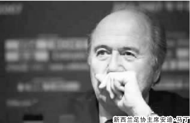
新西兰足协主席安迪·马丁

新华社惠灵顿7月14日电 新西兰足协主席安迪·马丁7月14日表示，自己对新西兰队被取消里约奥运会参赛资格的事件感到非常震惊，新西兰足协也将对此寻求上诉。