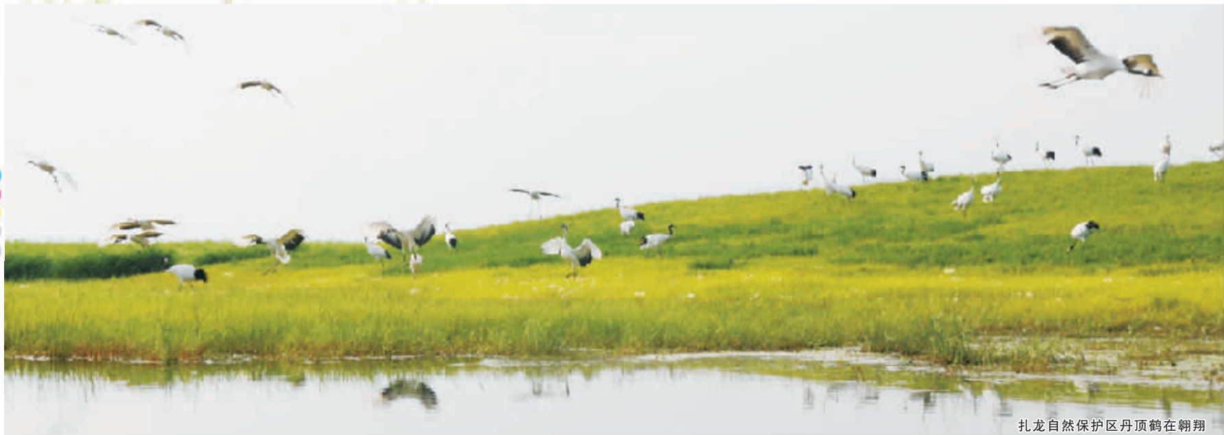
扎龙自然保护区丹顶鹤在翱翔