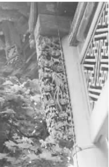
精美透雕“凤凰牡丹”