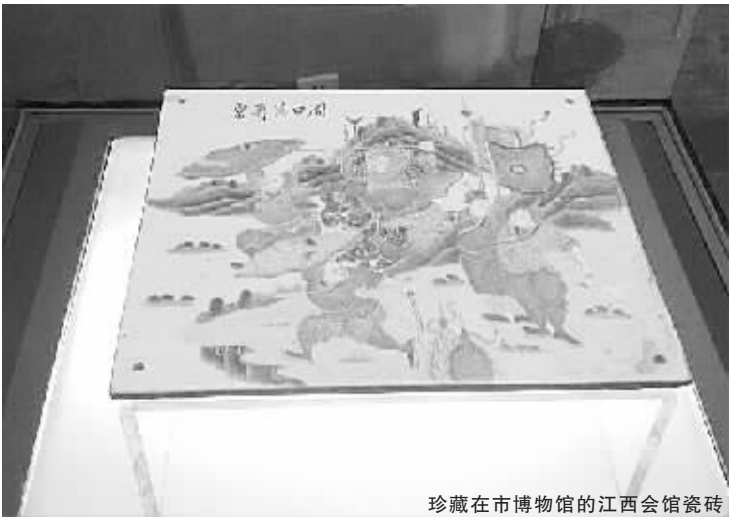
珍藏在市博物馆的江西会馆瓷砖

江西会馆，又称万寿宫，建于清乾隆四十五年(1780年)，原址位于如今的周口市区文昌大道上。在时间的磨砺中，由于种种原因，江西会馆已不复存在，原址上如今建的是环境优美的高档小区。但通过史料记载、实物印证等，世人应该能想象得到江西会馆的气势和规模，及它凭借独具一格的魅力造就的辉煌。