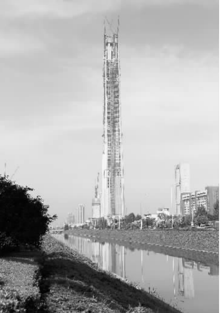
这是 9 月 8 日拍摄的天津 117 大厦。 当日,位于天津滨海高新技术产业开发区的天津 117 大厦正式封顶,结构高度达 596.5 米。之后 117 大厦将进入主体全面装修阶段,预计 2016 年底投入使用。

之一。按照《方案》要求,重大行政决策必须严格履行:公众参与、专家论证、风险评估、合法性审查、集体讨论决定的法定程序。 按照《方案》要求,考核结果将报省全面推进依法行政工作领导小组审定,采取适当形式公布或者通报,书面反馈给被考核对象,同时抄送省纪委和省委组织部。对连续 3 年考核优秀的考核对象及主要负责人提出表彰奖励建议报省政府。对连续 3 年考核不合格的,将具体情况报省政府。 据介绍,依法行政考核每年组织一次,采取日常考核与集中考核相结合、书面审查与实地考察相结合、专家评审与社会评议相结合的方式进行。对年度考核不合格的考核对象的主要负责人进行约谈,并作为督促整改重点单位,加强指导和监督。