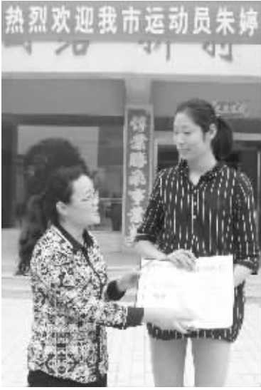
市妇联为朱婷颁发荣誉证书