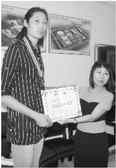
团市委为朱婷颁发荣誉证书