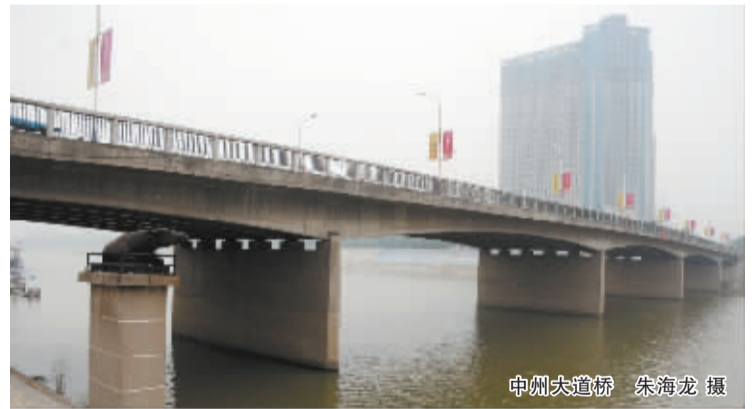
中州大道桥