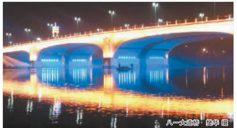
八一大道桥