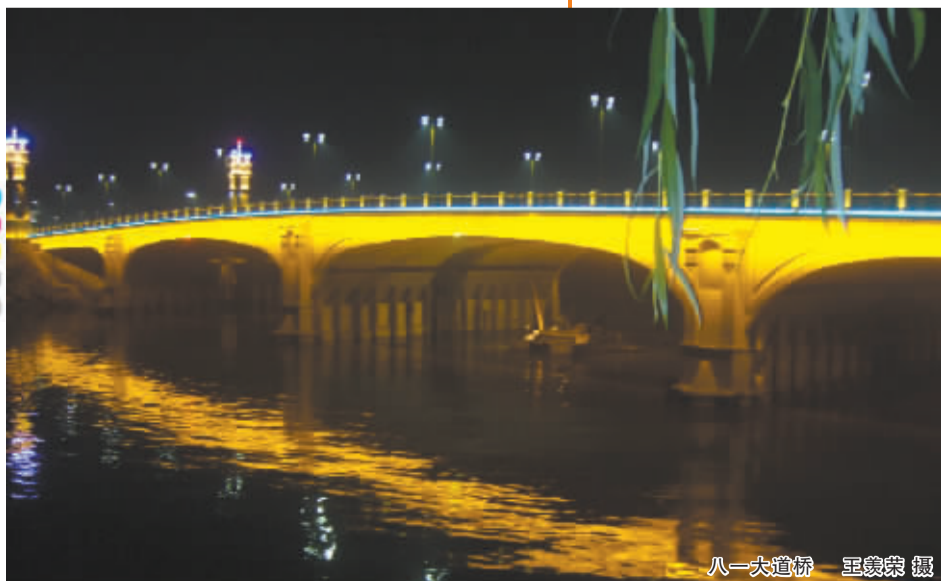
八一大道桥