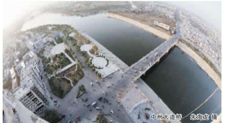
中州大道桥