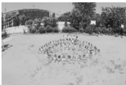
6月17日上午,周口文昌幼儿园大班的小朋友在老师的导演下,摆出不同的造型拍摄毕业照。