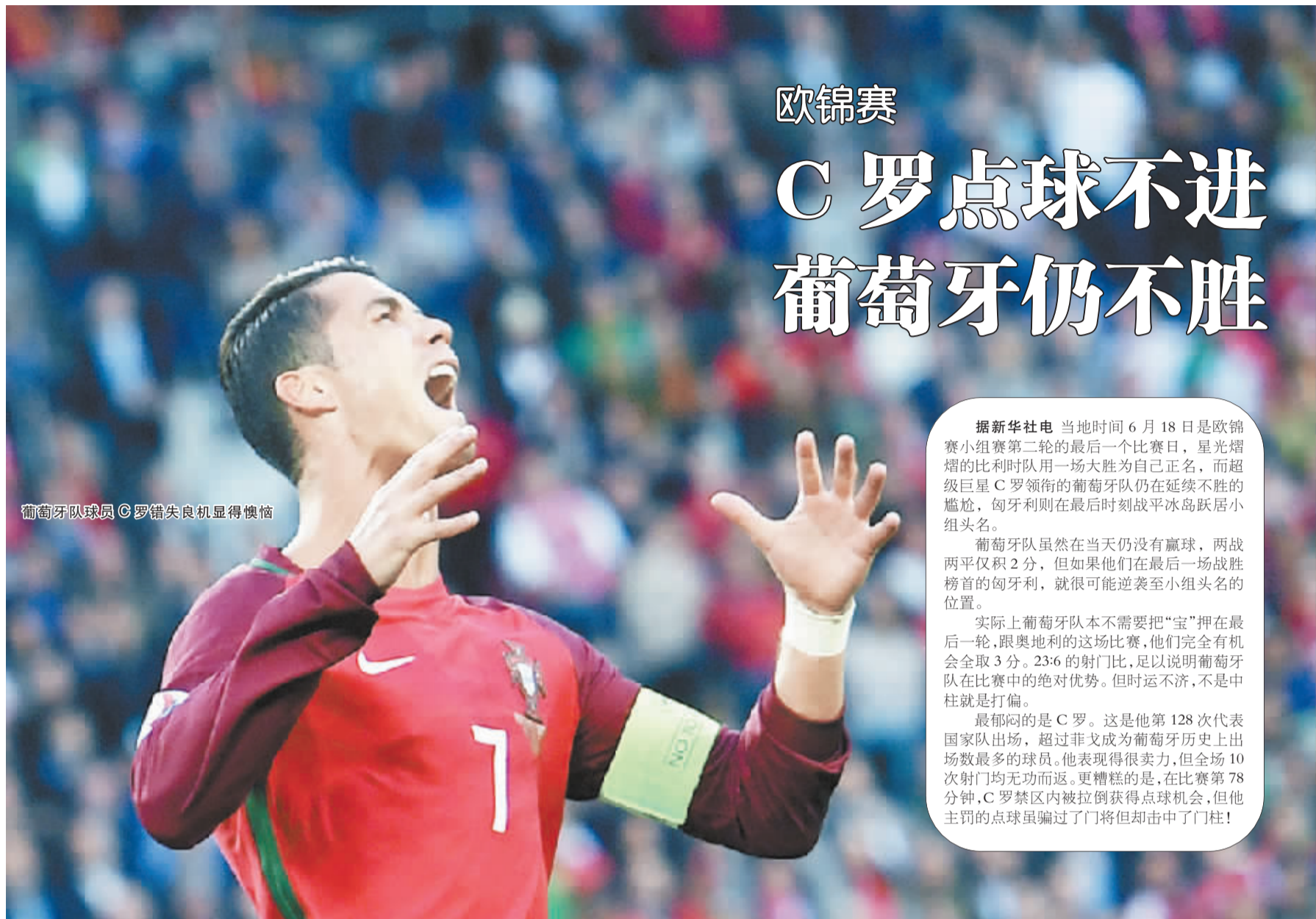
葡萄牙队球员C罗错失良机显得懊恼