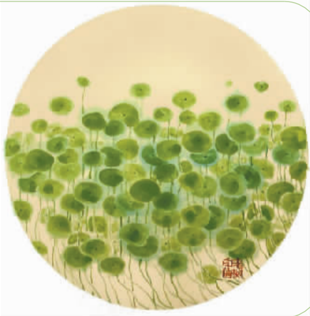
一钵铜钱草, 寂然在屋角。 仿佛有所思, 至今青未了。 老树画