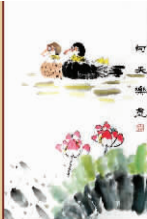
何天乐 12 岁