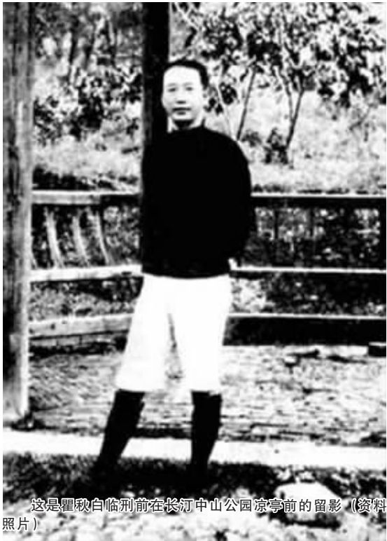
这是瞿秋白临刑前在长汀中山公园凉亭前的留影 (资料照片)

在中国革命历史上,有一首“绝笔”诗,诗名叫《梅岭三章》,其第一章这样写道:“断头今日意如何?创业艰难百战多。此去泉台招旧部,旌旗十万斩阎罗。”所幸的是,诗的作者陈毅在被敌人围困达 20 天之久后,躲过一劫。这首诗真实反映了南方游击战争的艰难处境。主力红军长征后,留在南方的一部分红军和游击队孤悬敌后,在 8 省范围内的 15 块游击区坚持游击战争,历时三年,史称“南方三年游击战争”。在这三年艰苦卓绝的游击战争中,许多同志,包括不少党和红军的高级干部献出了生命,在这里仅选择其中三位作扼要介绍。