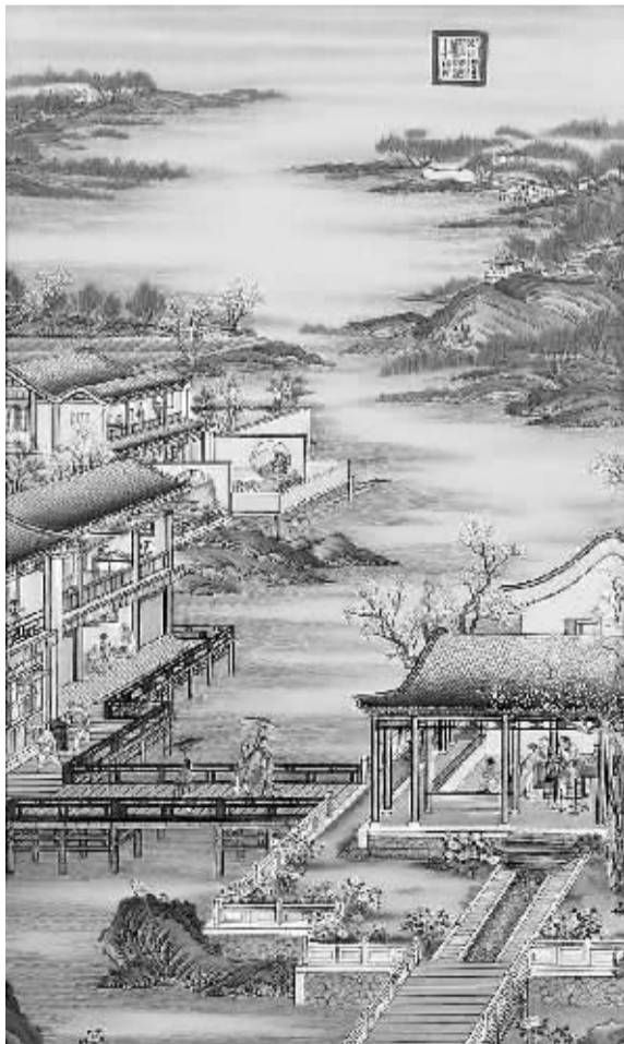
二月踏青 万物将期草木溶，取来蔬取杏花中。嫌君图卷层峦少，不会遍山灼灼红。