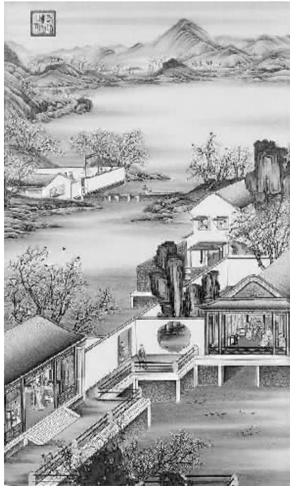
三月赏桃 天地多情且复苏，寻青踏马意多徐。相逢就借东君便，一咏一怀正当涂。（影像志）