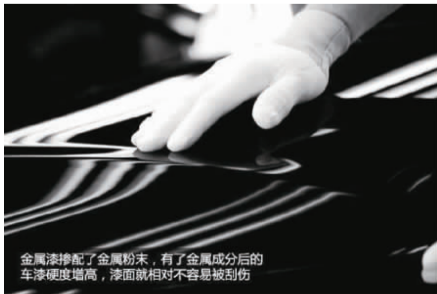
金属漆掺配了金属粉末，有了金属成分后的车漆硬度增高，漆面就相对不容易被刮伤

其实无论何种颜色的油漆，颜料在阳光下都是会退色的。这时油漆中的添加剂就很重要了，比如光稳定剂、抗氧化剂等等。许多时候厂商更关注的是均匀退色，尽量不使车身部分出现色差。