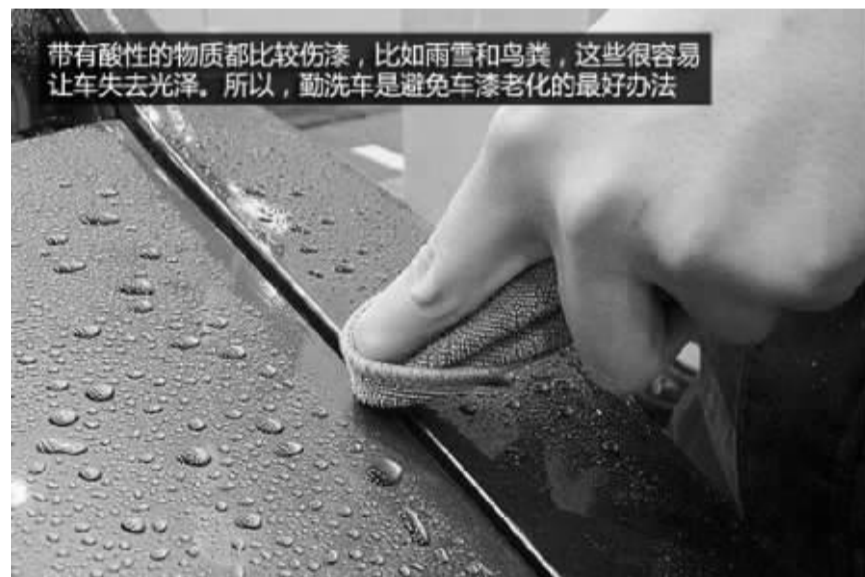
带有酸性的物质都比较伤漆，比如雨雪和鸟粪，这些很容易让车失去光泽。所以，勤洗车是避免车漆老化的最好办法