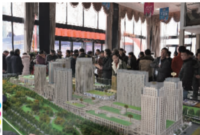
红星购物公园产品引起客户的极大兴趣