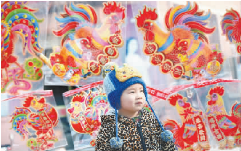
1 月 24 日,一名小朋友在山东省沂源县历山街道年货大集玩耍。 春节临近,山东省沂源县居民忙着置办年货、选购春节饰品,城乡处处洋溢着浓浓的年味。