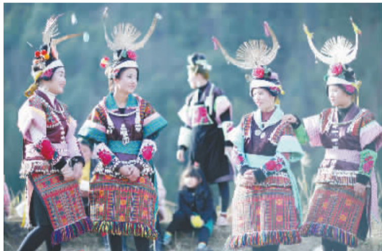
2 月 5 日,在贵州省丹寨县南皋乡湾寨村,身着盛装的苗族姑娘们欢聚在一起。当日,贵州省丹寨县南皋乡湾寨村迎来了一年一度的新春望会节,来自周边村寨的上万名苗族群众身着节日盛装,欢聚在芦笙场上,共庆佳节。