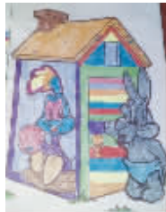
小记者:姜佳音 编号:171627 学校:周口八一路二小五(1)班