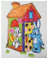
小记者:迟岚兮 编号:170860 学校:周口实验小学一(1)班