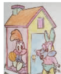
小记者:郝梓涵 编号:170855 学校:周口实验小学一(1)班