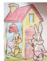
小记者:袁铭骏 编号:171162 学校:周口实验小学五(2)班