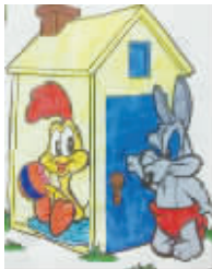
小记者:魏启梦 编号:171329 学校:周口李庄小学三(2)班