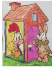
小记者:徐珂雯 编号:172219 学校:周口六一路小学一(1)班