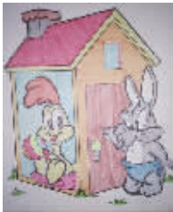
小记者:马超然 编号:172288 学校:周口六一路小学二(3)班