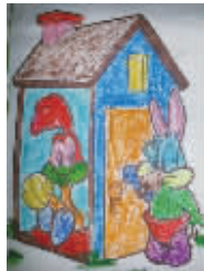
小记者:霍景旭 编号:172303 学校:周口六一路小学二(3)班