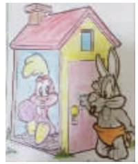
小记者:张瑶瑶 编号:171365 学校:周口建设路小学一(1)班