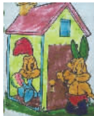
小记者:高梓谦 编号:171129 学校:周口实验小学四(5)班