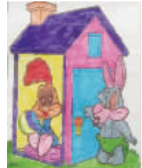
小记者:李欣雨 编号:171033 学校:周口实验小学三(3)班