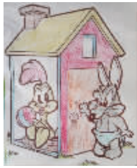
小记者:纪懿源 编号:171030 学校:周口实验小学三(3)班