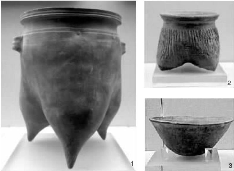
1.禹城市邢寨汪遗址出土的灰陶鬲