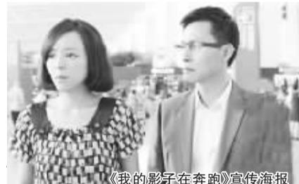
《我的影子在奔跑》宣传海报